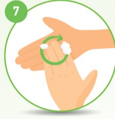
7 नाखून तथा उंगलियों के सिरे