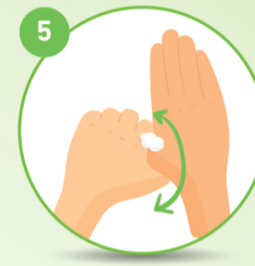
5 अंगूठों पर ध्यान दें