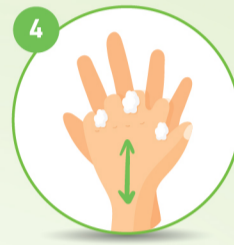
4 उंगलियों के बीच में