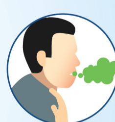
सांस लेने में तकलीफ