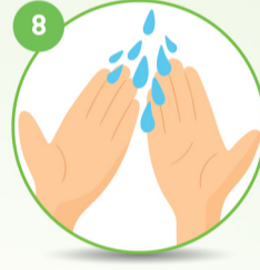
8 हाथों को धोएं