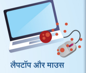
लैपटॉप और माउस