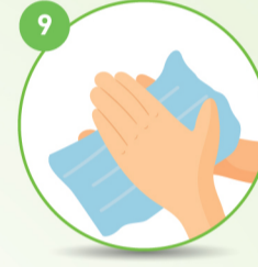
9 हाथों को सुखाएं

साबुन और पानी न हो तो 60% से ज़्यादा अल्कोहल मात्रा वाले हैंड सेनिटिज़र से हाथों को अच्छे से साफ़ करें.