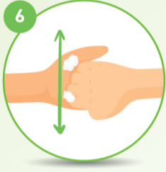
6 उंगलियों के पीछे