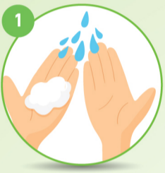
1 पानी और साबुन

अपने हाथों को बार-बार साबुन द्वारा कम से कम 20 सेकंड तक नीचे दिए गए अंकानुसार धोएं: