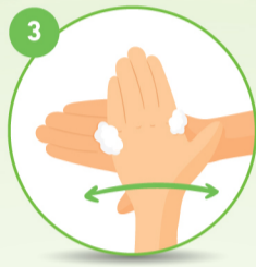
3 हाथों के पीछे की तरफ