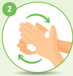
2 हथेली से हथेली