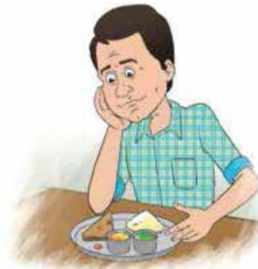
খিদে কমে যাওয়া।