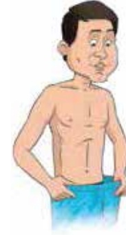
ওজন কমে যাওয়া।