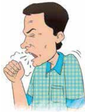
কাশির সাথে শ্লেষ্মা বেরনো।