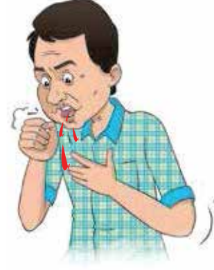
దగ్గినప్పుడు నోటి నుండి రక్త కారడం