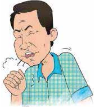
2 వారాల కంటే ఎక్కువ సమయానికి దగ్గుతూ ఉండడం