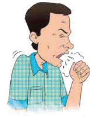
کھانسی کے ساتھ بلغم آنا۔