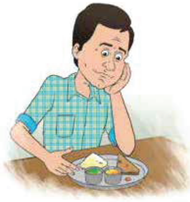
بھوک کم ہونا۔