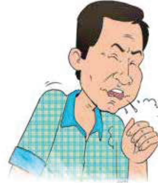
2 ہفتے سے زیادہ کھانسی۔