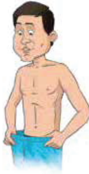
وزن کم ہونا۔